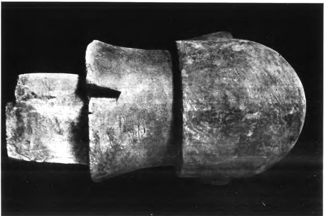
PALERMO - MUSEO NAZIONALE — Veduta di tergo dell'insieme e della testa della statua cineraria della coll. Casuccini