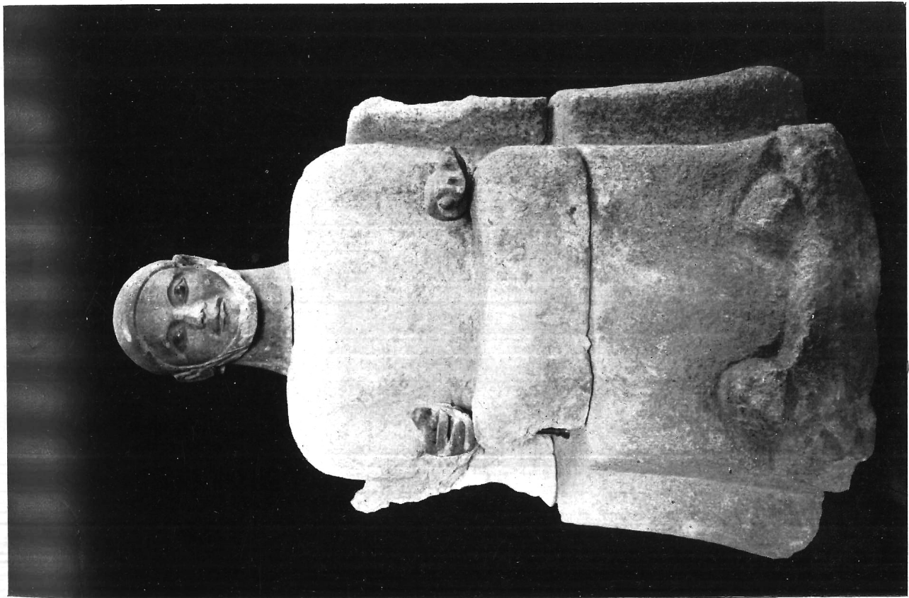
PALERMO - MUSEO NAZIONALE — Statua cineraria chiusina della collezione Casuccini