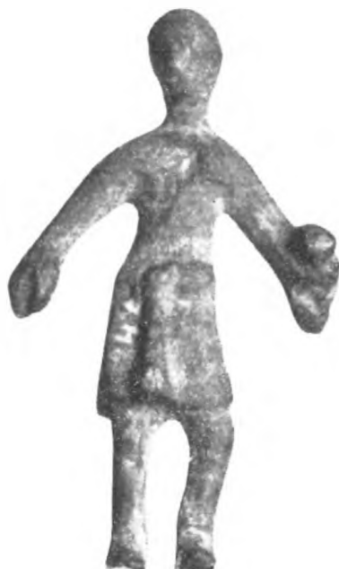
Fig. 35 a.

I tratti del volto, girato a destra, sono quasi irriconoscibili.