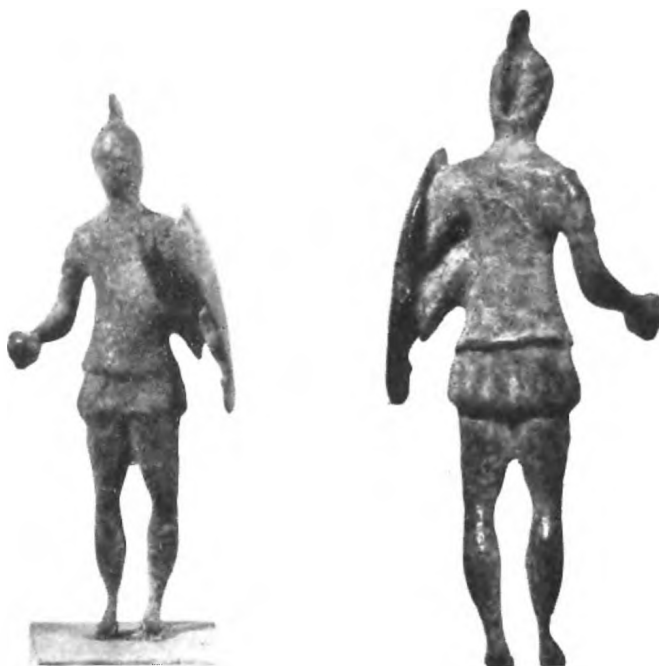
Fig. 6 a.

Stante sulla gamba destra, ha flessa leggermente la sinistra. Busto teso,