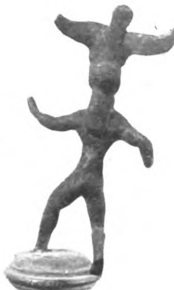
Fig. 27 b.

La figura è tutta agitata nell'atto di incedere. Ritmo della Gorgone del frontone di Corfù e di molte figure usate spec. come manici (cfr. Reinach Rép. St. II, 1, N. 390).