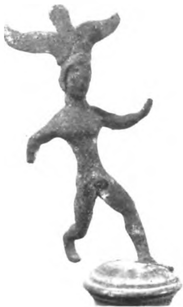
Fig. 27 a.