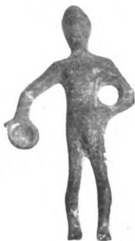
Fig. 36 a.