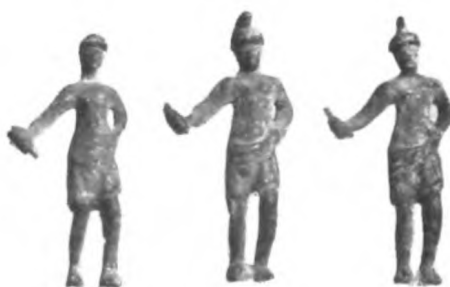
Fig. 37 b.