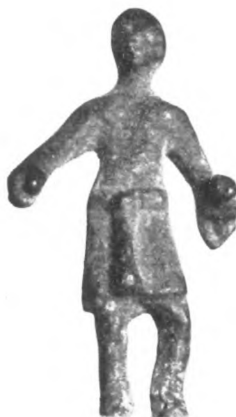
Fig. 35 b.