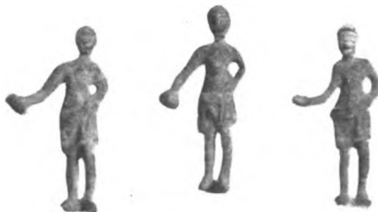
Fig. 37 a.