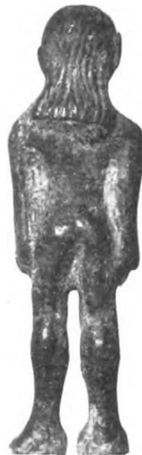
Fig. 1 b.

La massa dei capelli, segnata da graffi ad S stretto, è staccata dalla fronte con un solco netto e discende sulle spalle lentamente ondulata e aderente in modo da mantenere con una zazzera evidente il modellato sia della nuca che del collo.