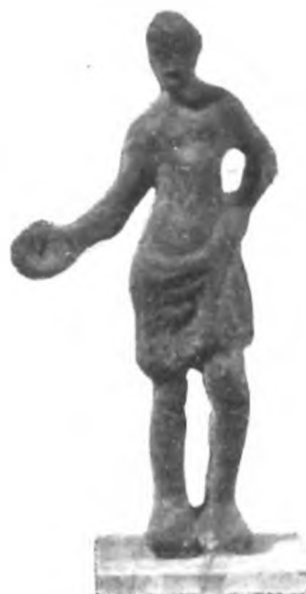
Fig. 36 d.

che doveva essere disposta in diagonale rispetto alla verticale del prospetto, o d'altro oggetto ora incomprensibile.