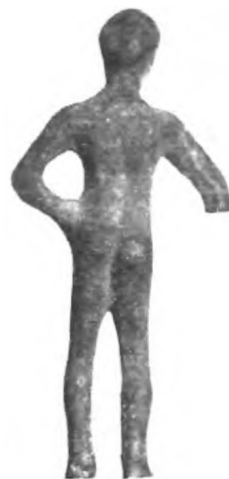
Fig. 36 b.