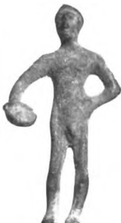
Fig. 36 c.