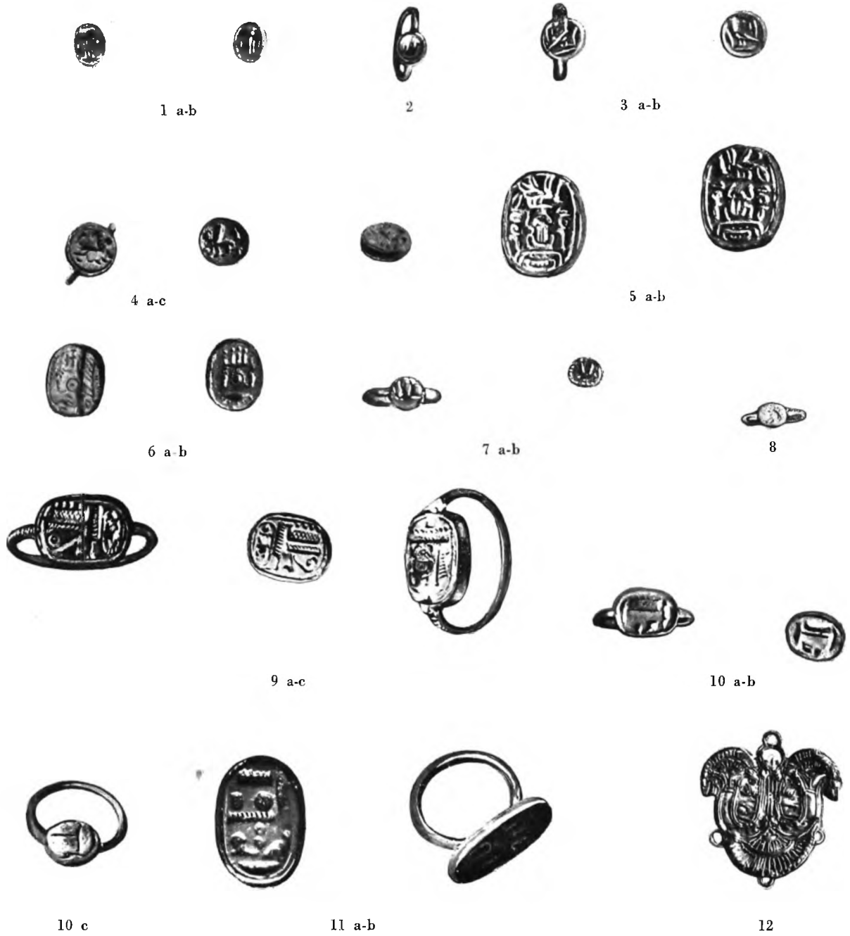
ROMA — MUSEO GREGORIANO ETRUSCO DEL VATICANO Scarabei e anelli d'oro, piastine in oro (Vulci e provenienza etrusca incerta)