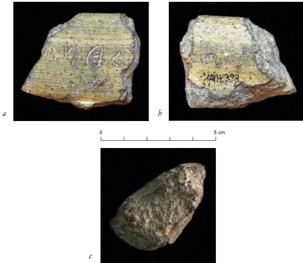
fig. 1 - a-b) Frammento di anfora punica con iscrizione etrusca; c) Profilo del frammento.

del tipo viene fatta iniziare prima della conquista di Cartagine e proseguire dubitativamente fino alla fine del II secolo a.C. 3 Quanto al contenuto J. Ramon Torres non specifica quello del tipo T-5.2.1.3, ma in un'anfora del gruppo T-4 o T-5 da Olbia sono state rinvenute ossa di bue o di maiale 4 .