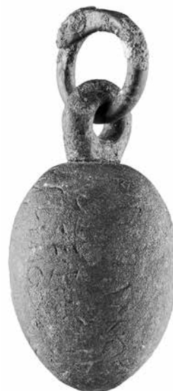
fig. 1 - Il peso bronzeo di Sant'Antonio, Cerveteri.

Come da ultimo osservato da Luciano Agostiniani e riepilogato da Riccardo Massarelli a proposito dell'incipit, l'apparente ambiguità nei ruoli dei destinatari della dedica e del donatore doveva essere risolta da altri fattori contestuali 6 . Le forme raθs turmsal sono state dunque tradizionalmente intese come destinatari della dedica del peso, soprattutto a partire dalla proposta di Giovanni Colonna, che ha suggerito a più riprese di vedere in Raθ una divinità equiparata ad un Apollo infero, che nel peso di S. Antonio si affiancava all'altrimenti noto Mercurio 7 . Le proposte più recenti e più innovative sono rappresentate dagli interventi di Mario Torelli e di Riccardo Massarelli 8 . Il primo ha evidenziato il ruolo mantico di Raθ intendendo la dedica in riferimento al manteion all'interno del tempio di Turms (il tempio A, dal momento che il B sembra da identificare con l'edificio sacro a Ercole), il secondo suggerendo per raθ un diverso significato in diretta relazione con il supporto iscritto e proponendo di riferire la formula iniziale all'espressione della conformità del peso.