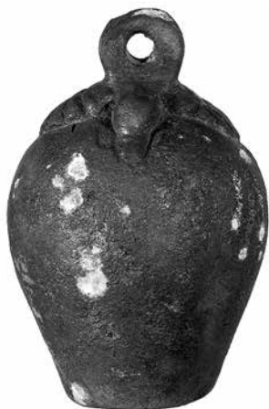
fig. 2 - Il peso bronzeo anepigrafe dalla tomba dei Vasi Greci di Cerveteri.

ma questa volta in ambito funerario, proviene inoltre un'ulteriore testimonianza inedita. Si tratta di un ulteriore peso anepigrafe in bronzo (e piombo?) restituito dalla cella destra della nota tomba dei Vasi Greci 52 . Il peso, campaniforme e rastremato verso il basso, con robusto anello di sospensione e attacco ornato da una coppia di palmette ( fig. 2 ), pesa 174,18 g, ovvero poco meno della metà di una libbra, questa volta pesante (358 g, secondo il peso ricostruito per le attestazioni di area padana) 53 . Un confronto per la forma, ma non per l'unità di peso, è dato dall'esemplare di Ponte Gini (Lucca), di 113,66 g, equiparato da Maggiani al sistema romano dello scripulo e attribuito al IV-III secolo a.C. in base al contesto archeologico 54 . Il corredo della tomba dei Vasi Greci, com'è noto, si data solitamente al VI-V secolo a.C. per la quantità di importazioni di ceramica attica presenti nella tomba 55 , ma non mancano materiali più antichi, come fiaschette in faience, né più recenti, se si considera anche la presenza, oltre al peso, di una coppetta a vernice nera ancora dalla cella destra della tomba 56 .