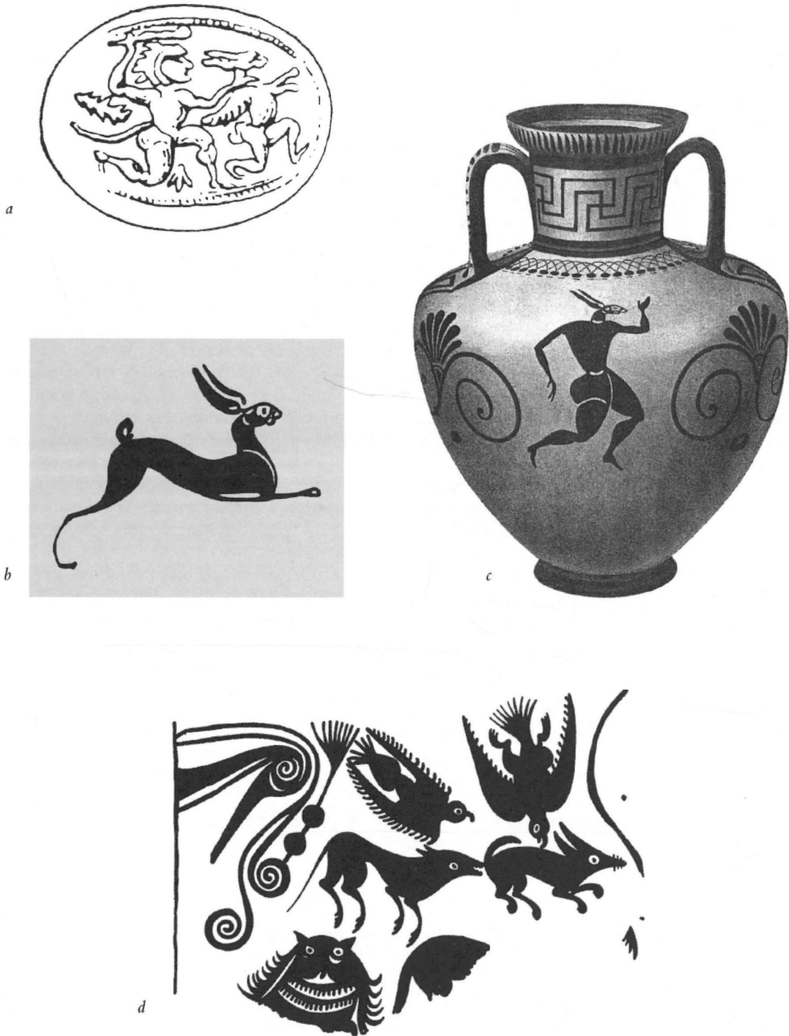
tav. I - a ) Anello d'oro della collezione Campana al Louvre (da Mastrocinque 1993); b ) Particolare di un'anfora della classe di Fikellura attribuita al Running Man painter (da Cook - Dupont 1998); c ) Anfora della classe di Fikellura da Camiro al Louvre (da Zervos 1920); d ) Parte di un kalathos iberico del Museo di Teruel (da Arribas 1982).